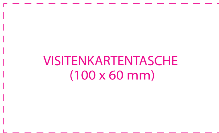
VISITENKARTENTASCHE (100 x 60 mm)