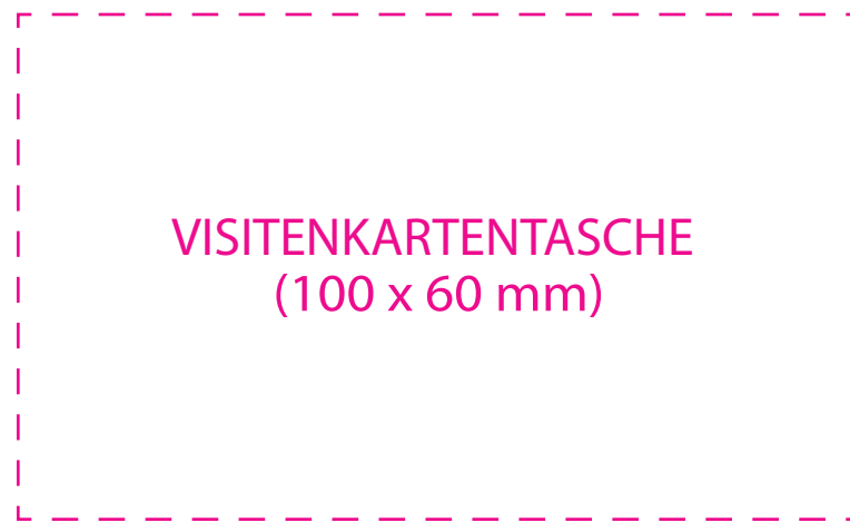
VISITENKARTENTASCHE (100 x 60 mm)