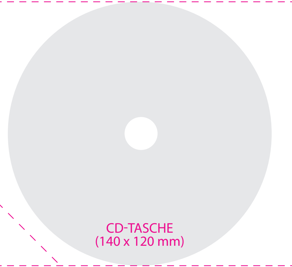
CD-TASCHE (140 x 120 mm)